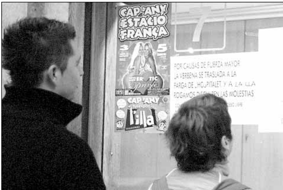
Dos joves, la nit de Cap d'Any, davant un cartell que anuncia la suspensió de la festa

Concretament, els punts d'informació van repartir mapes d'accés al Poliesportiu l'Illa, que té un aforament per a 2.000 persones, i la Farga de