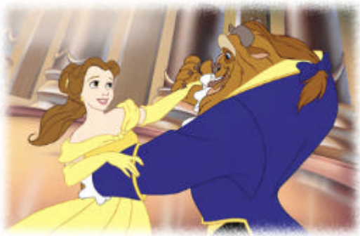
Noche del baile en el castillo

Así, cuando se aleja, la Bestia ofrece a Bella un instrumento para que le recuerde. En el caso del cuento le da un anillo ( I^2 ) que, más que para recordarle, sirve para regresar al castillo con él transcurrida la semana de permiso para ver a su padre, aunque Bella permanecerá dos días más de los acordados con la Bestia (M). En cambio, en la película, la Bestia deja completamente libre a Bella y le da un espejo ( I^3 ) para que pueda observarlo de vez en cuando.