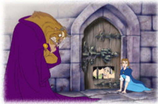
Bestia encierra al padre de Bella en el calabozo. Bella viene para substituir a su progenitor

Siguiendo el cuento, el padre, después de la amenaza de la Bestia, regresa a casa para plantear la situación a sus hijas. En cambio, en la película, y como ya hemos dicho, el padre permanece encerrado e incomunicado con el exterior.