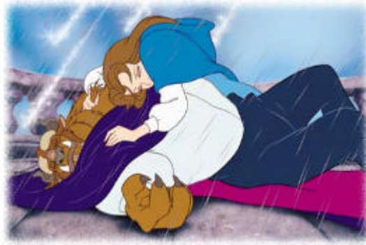
Bella abraza a Bestia al final del combate contra Gastón. Es aquí cuando confiesa su amor por ella.

Bella pasa de la creencia de que tiene que elegir entre el amor por su padre y el amor por la Bestia, al descubrimiento de que el considerar como antagónicos estos dos afectos comporta una visión inmadura de las cosas. Al transferir el amor edípico original a la Bestia, Bella otorga a su padre un afecto mucho más satisfactorio para éste. Así, puede recuperarse de su enfermedad y vivir una existencia feliz al lado de su querida hija. Este mismo hecho devuelve a la Bestia su carácter humano, con lo que da comienzo una vida de felicidad conyugal para ambos.