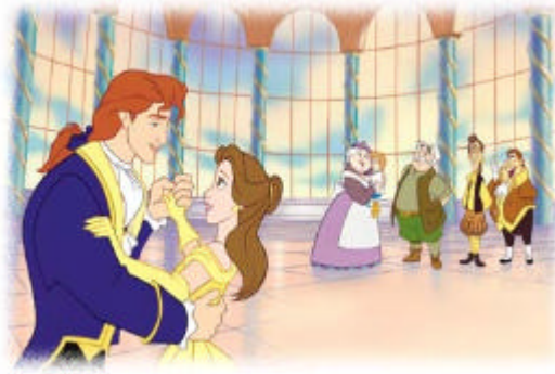
La Bestia, ya transformada en príncipe baila al final con Bella.

Pero, hemos visto que aunque ambas historias, tanto el cuento como la película, mantengan una misma moraleja, hay diferencias notables.