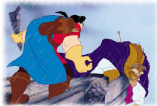
Gastón luchando contra la Bestia

Así, el falso - héroe y agresor es eliminado, de una manera muy parecida a como lo fue la reina en «Blancanieves y los siete enanitos», siendo arrojada al vacío. Aquí apreciamos que él era el agresor directo y el falso – héroe respecto a la Bestia.