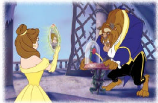
Bestia ofrece a Bella el espejo

Sumida en el conflicto entre el amor por su padre y la necesidad de la Bestia, Bella abandona a esta última para acudir junto a su padre. Pero, gracias a ello, se da cuenta del afecto que siente por la Bestia.